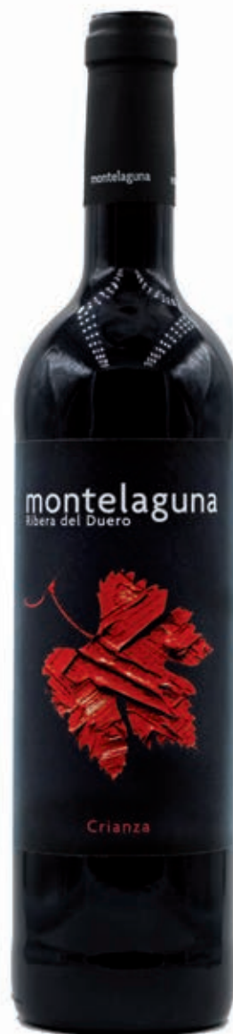
CRianza 2015 12 MESES DE BARRICA