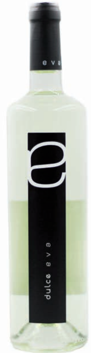
DULCE EVA BLANCO SEMIDULCE COOPERATIVA VIRGEN DE LA ESTRELLA VINO DE LA TIERRA DE EXTREMADURA