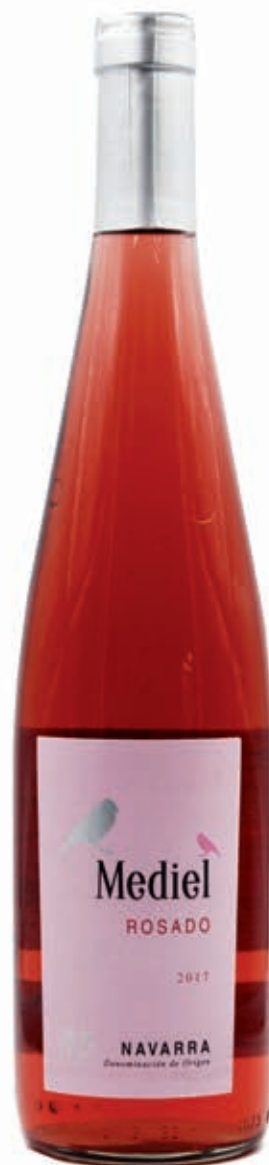
MEDIEL ROSÉ GARNACHA - TEMPRANILLO NAVARRA D.O.