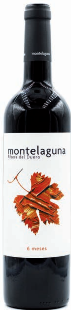
ROBLE 2016 6 MESES DE BARRICA

Su singularidad se establece desde un primer momento por la situación de sus viñedos a más de 900 m sobre el nivel del mar, cuando la media de la Ribera del Duero no supera los 740 metros.