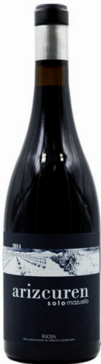
ARIZCUREN SOLO MAZUELO 100% MAZUELO SIERRA DE YERGA RIOJA D.O.C.