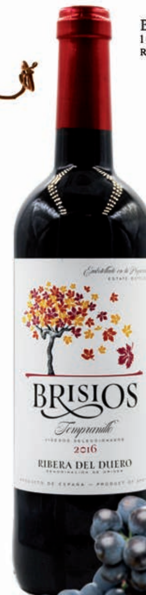
BRISIOS ROBLE 100% TEMPRANILLO RIBERA DEL DUERO D.O.