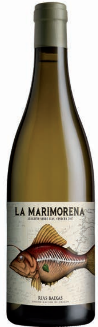
LA MARIMONERA 100% ALBARIÑO RIAS BAIXAS D.O.