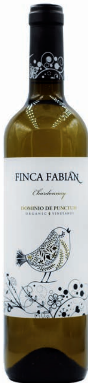
FINCA FABIÁN DOMINIO DE PUNCTUM 100% CHARDONNAY ECOLÓGICO D.O. LA MANCHA VINO BIODINÁMICO