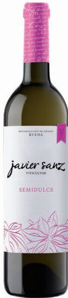
SEMIDULCE LA SECA- VALLADOLID RUEDA D.O.- VERDEJO 100%