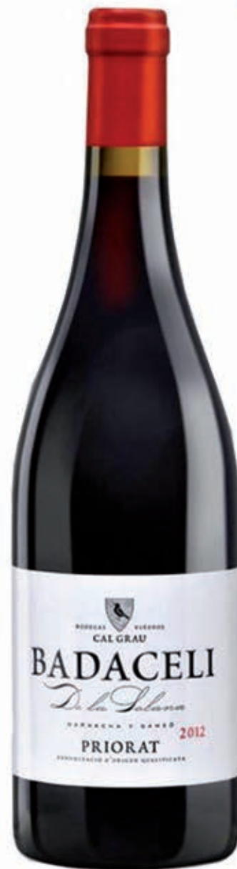
BADACELI PRIORAT D.O.Q. 40% CARIÑENA - 60% GARNACHA 6/12 MESES EN BARRICAS NUEVAS Y DE 2º AÑO DE ROBLE FRANCÉS BODEGAS CAL GRAU