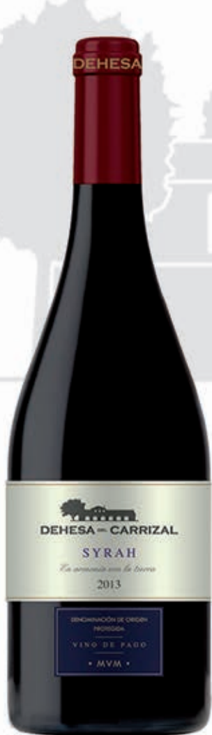
SYRAH 2013 12-14 MESES DE CRIANZA DEHESA DEL CARRIZAL D.O.P. GRANDES PAGOS