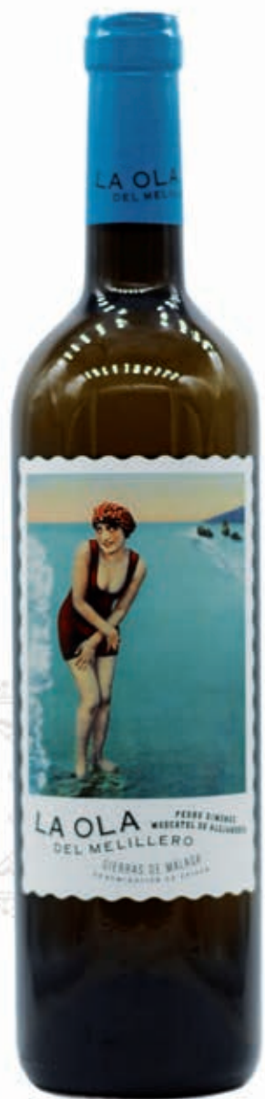
LA OLA DEL MELILLERO PEDRO XIMENEZ & MOSCATEL DE ALEJANDRÍA SIERRAS DE MÁLAGA D.O.