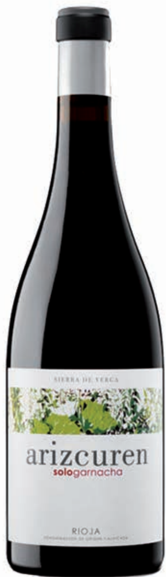
ARIZCUREN SOLO GARNACHA 100% GARNACHA SIERRA DE YERGA RIOJA D.O.C.