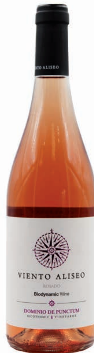
VIENTO ALÍSEO ROSÉ DOMINIO DE PUNCTUM 100% BOBAL D.O. LA MANCHA VINO BIODINÁMICO