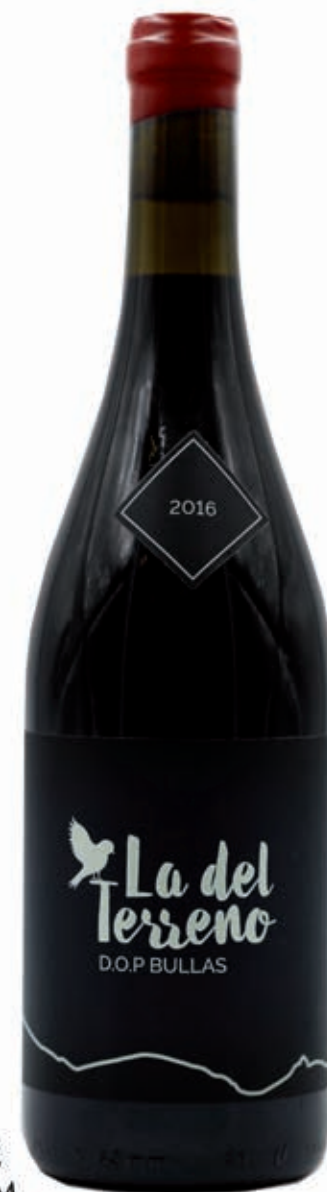
LA DEL TERRENO JULIA CASADO 95% MONASTRELL CULTIVADO EN OGÁNICO D.O.P. BULLAS