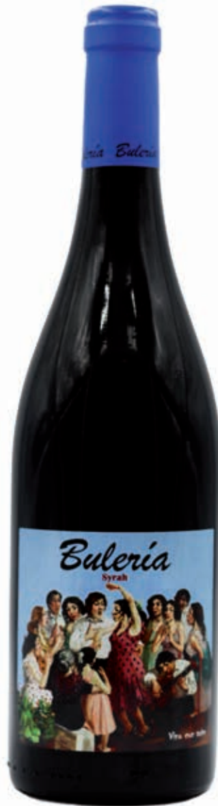
BULERÍA SYRAH 100% SYRAH BODEGAS DIOS BACO JEREZ DE LA FRONTERA CÁDIZ