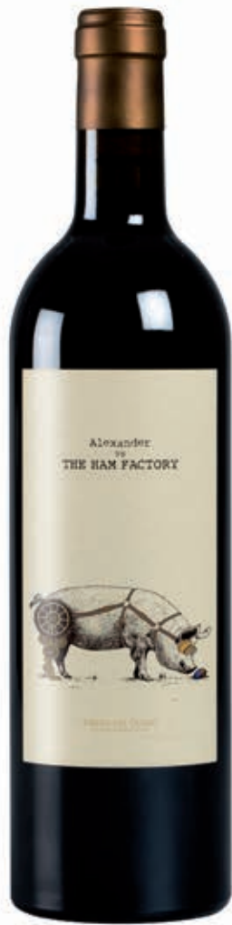
ALEXANDER VS THE HAM FACTORY 100% TEMPRANILLO RIBERA DEL DUERO D.O.