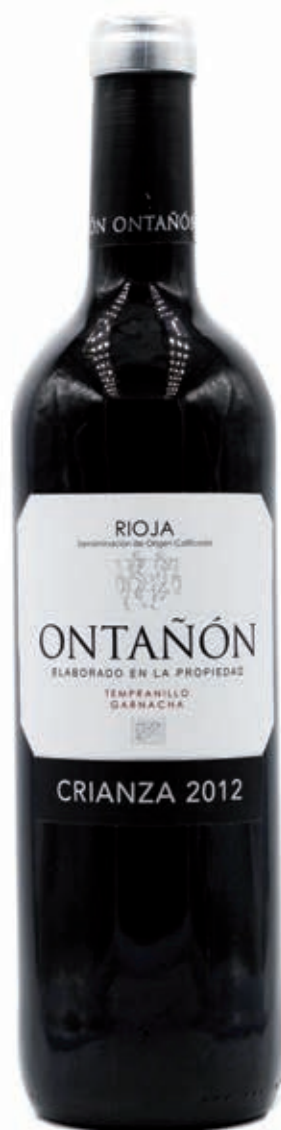
ONTAÑÓN CRIANZA TEMPRANILLO - GARNACHA RIOJA D.O.C.