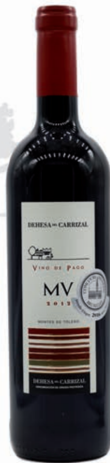
MV 2014 SYRAH, MERLOT, CABERNET Y TEMPRANILLO 8-10 MESES DE CRIANZA DEHESA DEL CARRIZAL D.O.P. GRANDES PAGOS