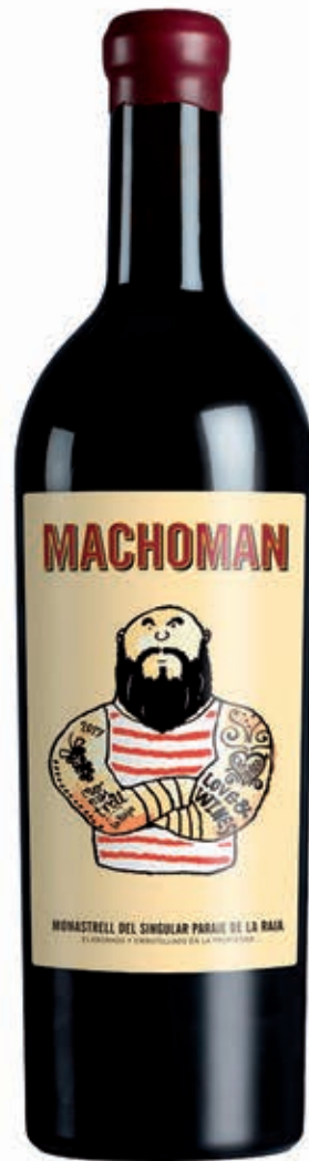
MACHO MAN 100% MONASTRELL JUMILLA D.O.