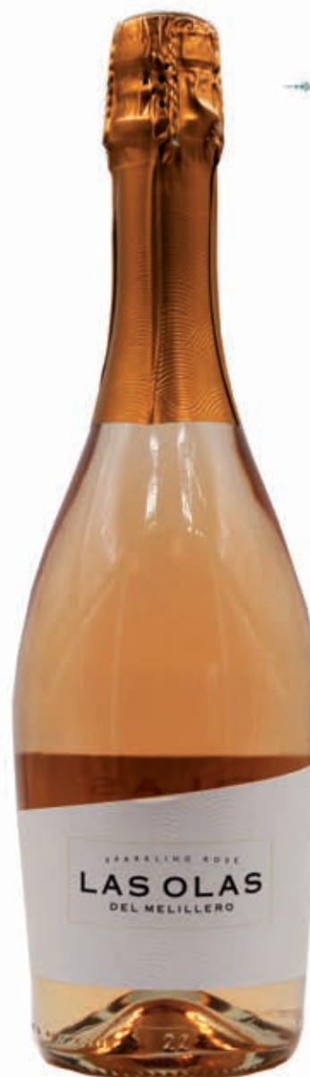
LAS OLAS DEL MELILLERO SPARKLING ROSÉ BRUT NATURE SYRAH, TEMPRANILLO, PETIT VERDOT & PEDRO XIMENEZ SIERRAS DE MÁLAGA D.O.