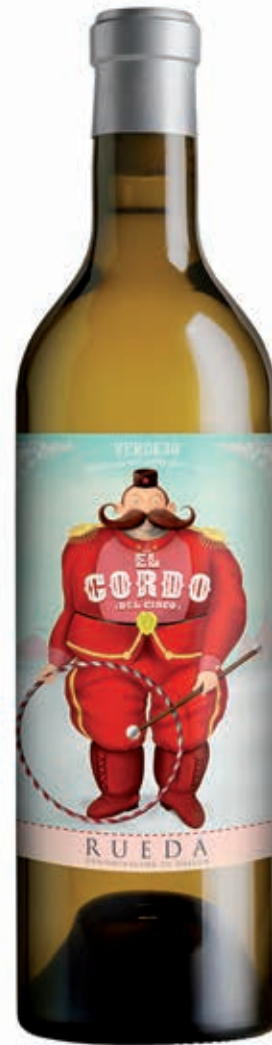
EL GORDO DEL CIRCO 100% VERDEJO RUEDA D.O.