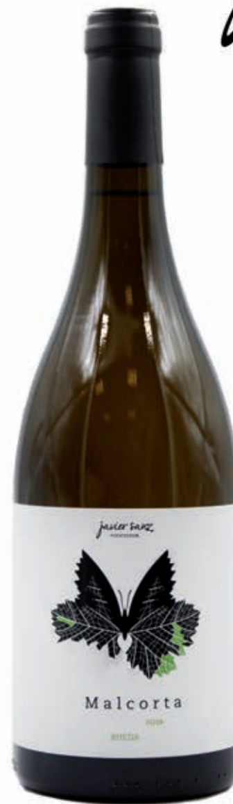
V MALCORTA LA SECA- VALLADOLID RUEDA D.O.- VERDEJO 100%