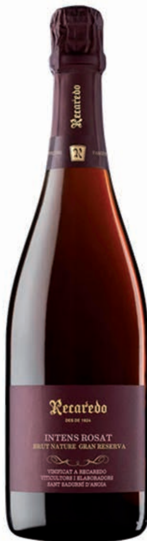
RECAREDO INTENS ROSAT BRUT NATURE GRAN RESERVA 51% MONASTRELL, 36% PINOT 13% GARNACHA CAVA D.O.