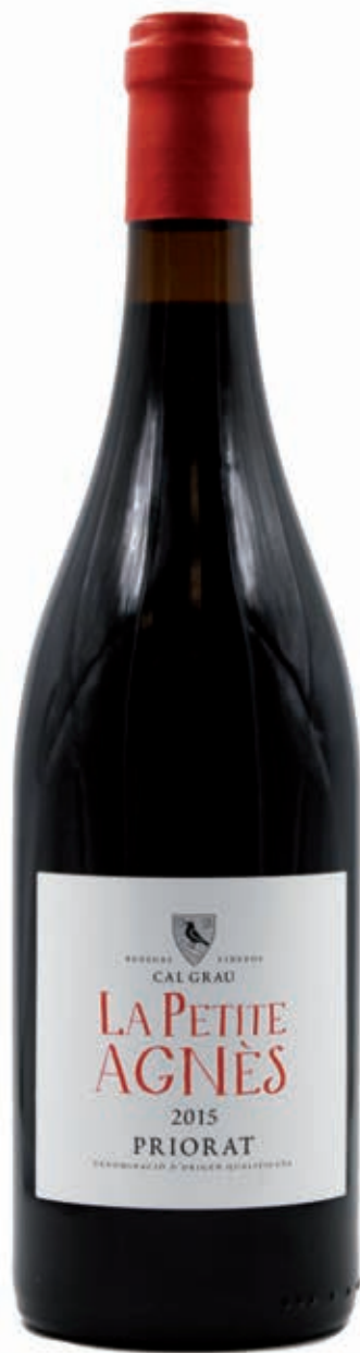
LA PETITE AGNÈS PRIORAT D.O.Q. 50% GARNACHA - 50% CARIÑENA 4 MESES EN BARRICAS DE ROBLE FRANCÉS BODEGAS CAL GRAU