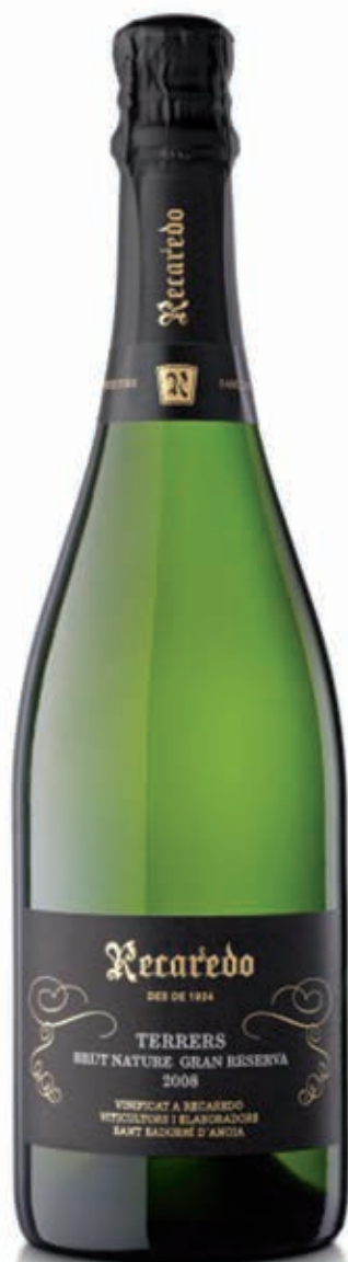
RECAREDO TERRERS BRUT NATURE GRAN RESERVA 58% MACABEO, 39% XARELLO, 3% PARELLADA CAVA D.O.

Desde el viñedo, pasando por la bodega y la cava, todos los procesos en Recaredo están auditados y certificados por el organismo independiente Bureau Veritas.