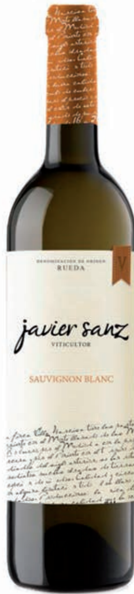
SAUVIGNON BLANC LA SECA- VALLADOLID RUEDA D.O