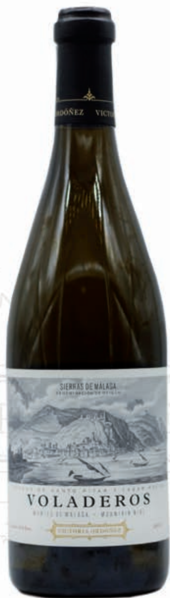
VOLADEROS PEDRO XIMENEZ SIERRAS DE MÁLAGA D.O.