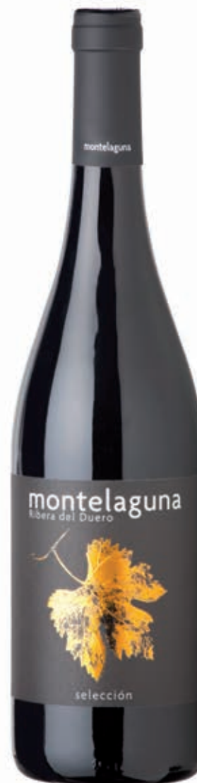
SELECCIÓN 2011 20 MESES DE BARRICA 3100 BOTELLAS