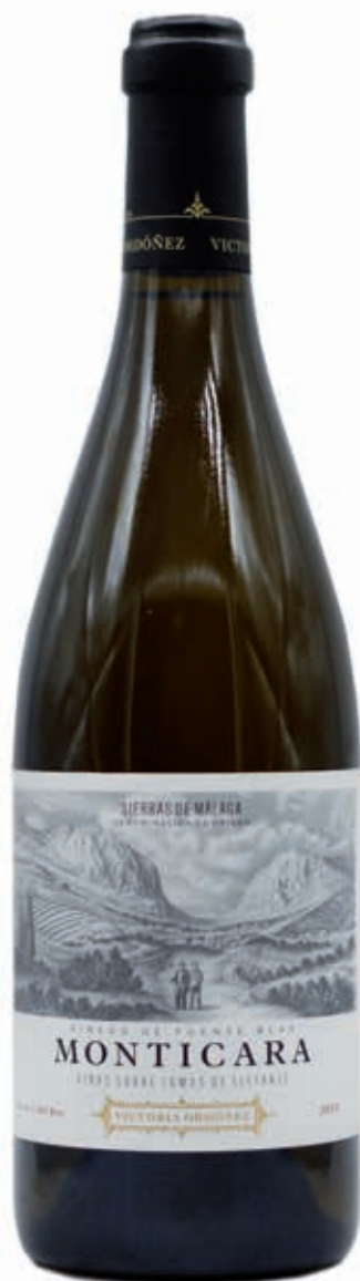
MONTICARA MOSCATEL DE ALEJANDRÍA SIERRAS DE MÁLAGA D.O.