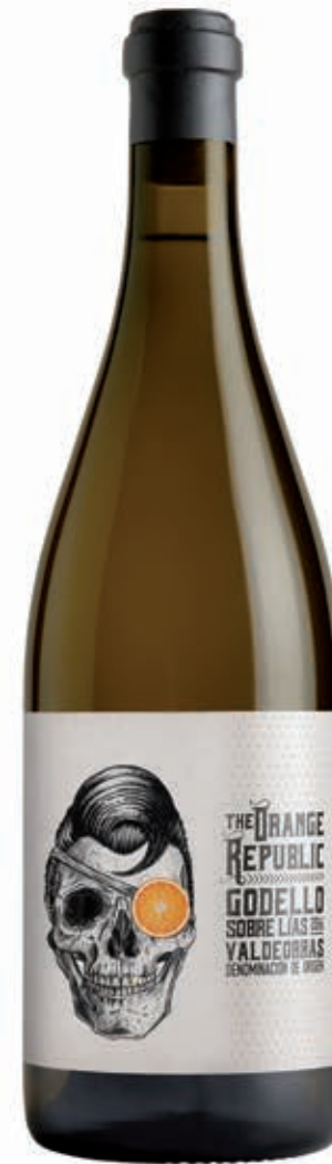
THE ORANGE REPUBLIC 100% GODELLO SOBRE LÍAS VALDEHORRAS D.O.