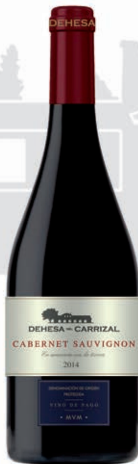
CABERNET 2014 12-14 MESES DE CRIANZA DEHESA DEL CARRIZAL D.O.P. GRANDES PAGOS