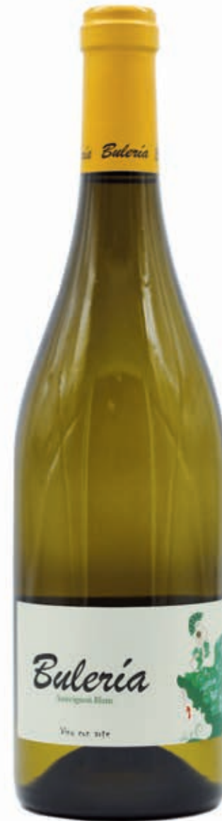
BULERÍA SAUVIGNON BLANC ARCOS DE LA FRONTERA