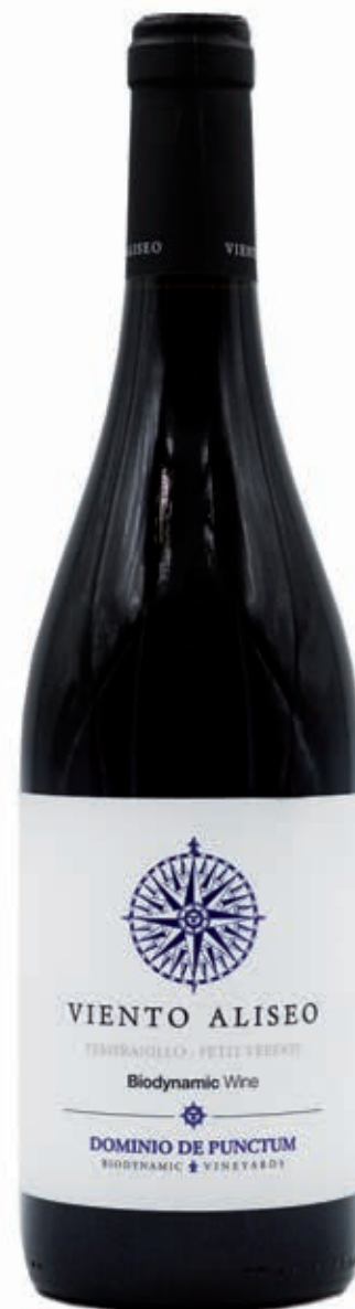
VIENTO ALÍSEO DOMINIO DE PUNCTUM 70% TEMPRANILLO, 30% PETIT VERDOT D.O. LA MANCHA VINO BIODINÁMICO