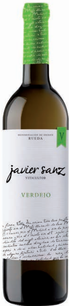
VERDEJO 100% LA SECA- VALLADOLID RUEDA D.O.- VERDEJO 100%