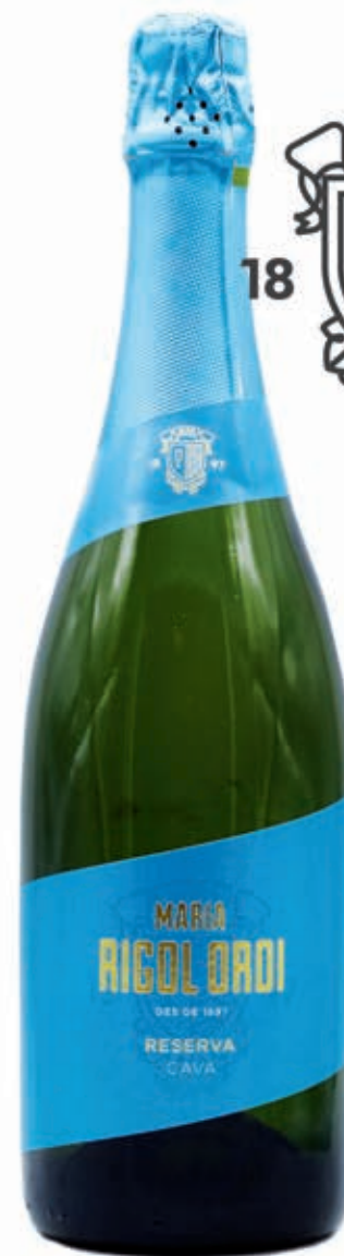
MARIA RIGOL ORDI RESERVA 36% MACABEO, 34% XAREL 30% PARELLADA 24 MESES DE CRIANZA CAVA D.O.