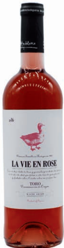
LE VIE EN ROSE ROSADO - TORO D.O. VERDEJO, TINTA DE TORO Y GARNACHA DE VIÑEDOS DE 15 AÑOS. CRIADO SOBRE LÍAS.