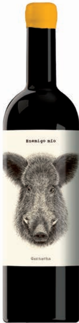
ENEMIGO MÍO 100% GARNACHA JUMILLA D.O.