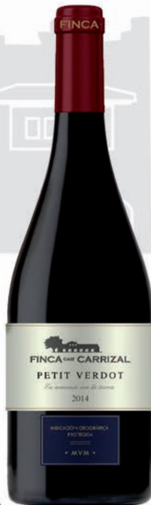
PETIT VERDOT 2014 12-15 MESES DE CRIANZA DEHESA DEL CARRIZAL D.O.P. GRANDES PAGOS.