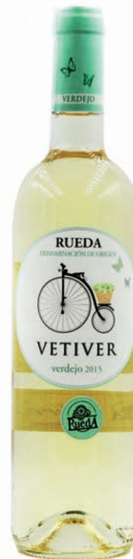
VETIVER VERDEJO RUEDA D.O.