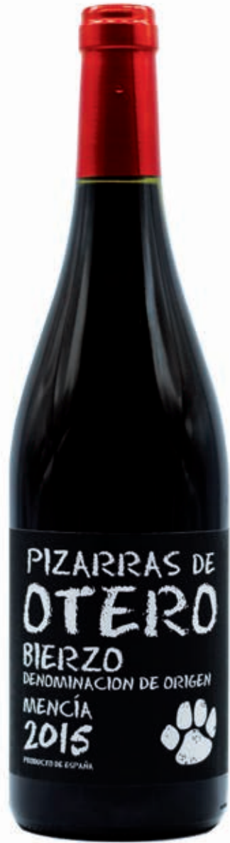
PIZARRAS DE OTERO 100% MENCIA BIERZO D.O. CACABELOS - LEÓN