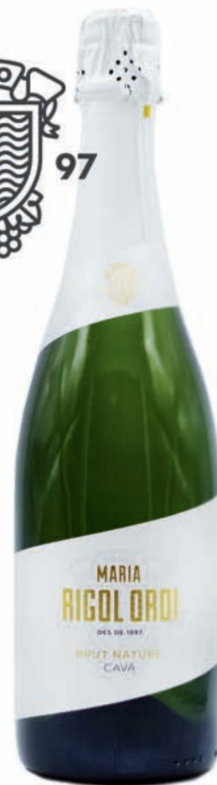
MARIA RIGOL ORDI BRUT NATURE 34% MACABEO, 33% XAREL 33% PARELLADA 15 MESES DE CRIANZA CAVA D.O.