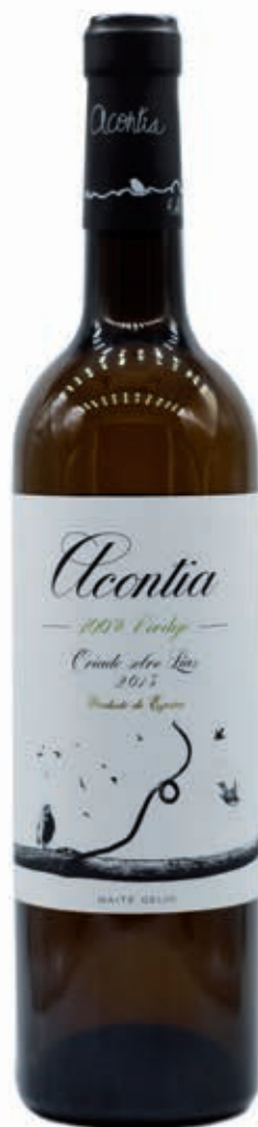
ACONTIA VERDEJO TORO D.O. 100% VERDEJO CRIADO SOBRE SUS PROPIAS LÍAS